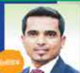
রিজ্ব মোহাম্মদ মন সংযোগ ও অফার সম্পাদক